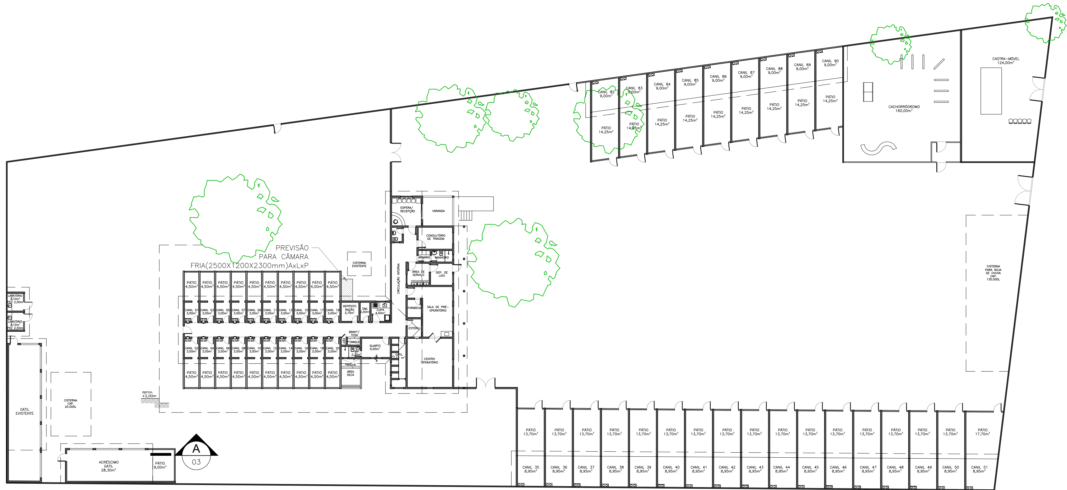
1 PLANTA DE ARQUITETURA ESCALA 1:250