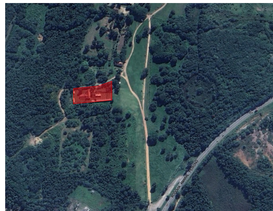
3 LOCALIZAÇÃO ESCALA 1/125