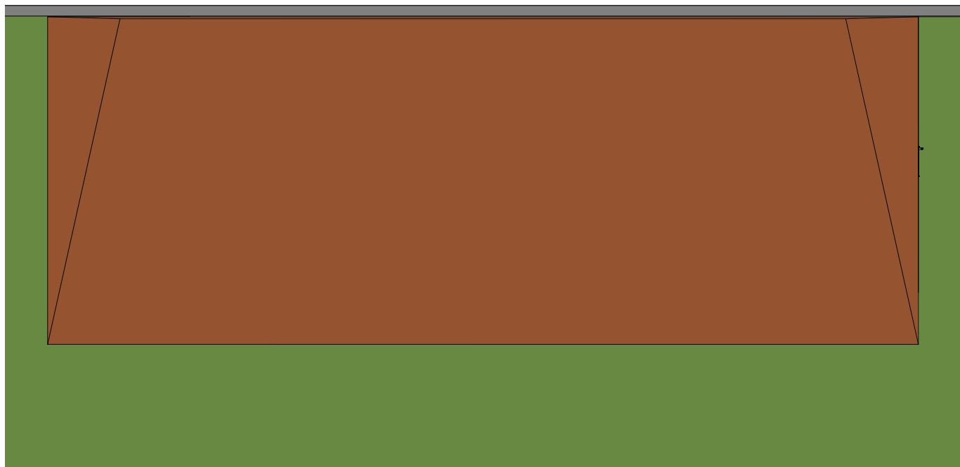
1 Acréscimo - vista superior