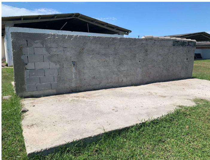
Foto 07, 08, 09, 10, 11, 12, 13 e 14 – Área da Pista Mangalarga atual

Estado do Rio de Janeiro PREFEITURA MUNICIPAL DE CABO FRIO SECRETARIA ADJUNTA DE OBRAS, SERVIÇOS PÚBLICOS E POSTURAS DE TAMOIOS.